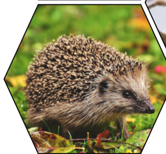
Goldglänzender Rosenkäfer Waldmaus Rotkehlchen Igel